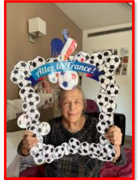
Nos résidents ont soutenu l'équipe de France avec enthousiasme